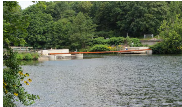
Los Ende III- Anfang IV