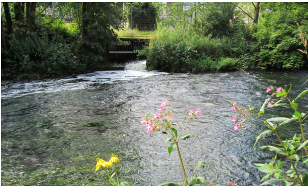
Los II Ende Anfang III