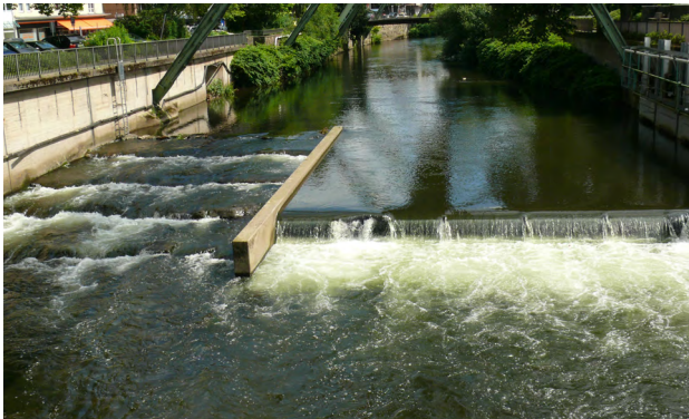
Los IX Fischtreppe

1. Brücke Wall bis Brücke Wesendonkstraße (Döppersberg)