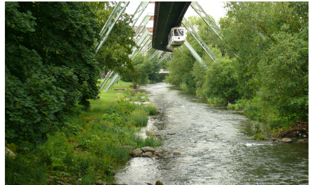
Los IX Rosenau