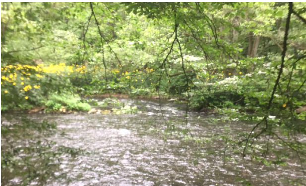
Los VI Anfang unterhalb der Fa. Erfurt

Im Bereich der Strecke (Los VI) der Fa. Erfurt & Sohn KG „Werksgelände“ ist Betreten und Fischen verboten .