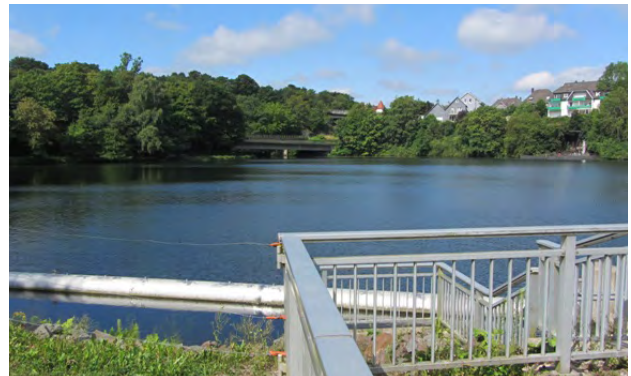
Los IV Ende Beyenburger Stausee