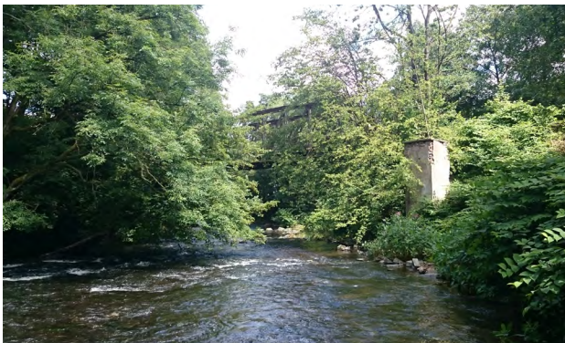
Los VII Anfang