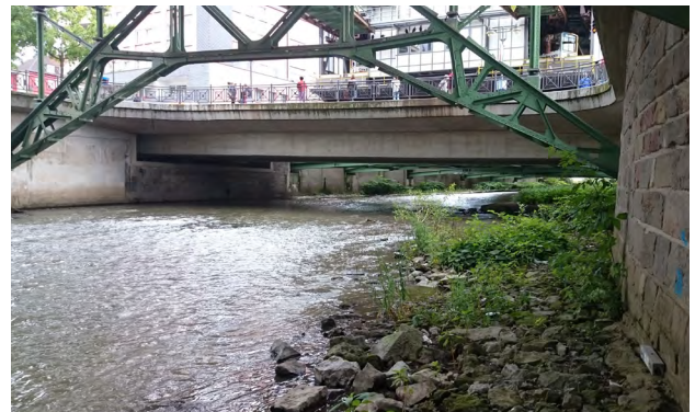
Los VII Brücke Berliner Platz