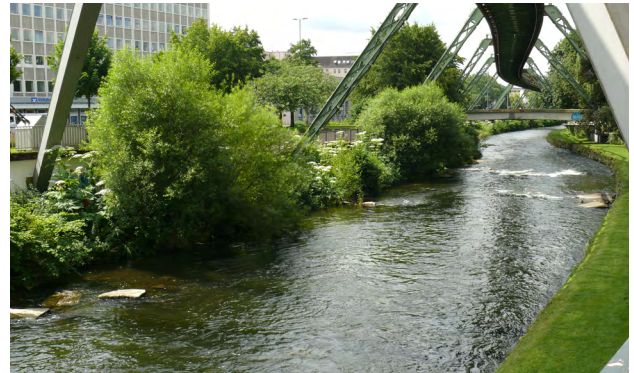
Los VIII unterhalb Brücke Steinberg