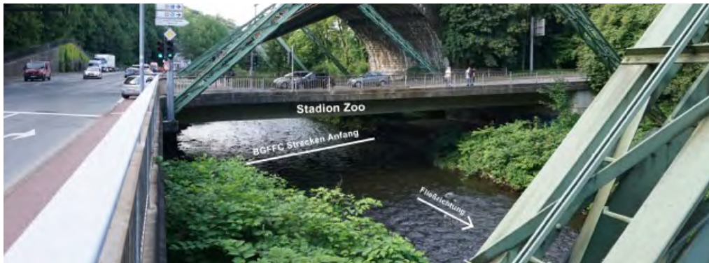
Los X Anfang

(Los X – XIII) Es besteht für die gesamte Strecke eine max. Entnahme von Salmoniden von 20 Stück pro Jahr!