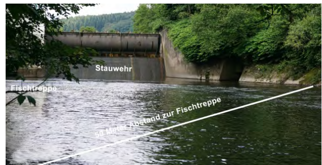
Los XI unterhalb Staumwehr