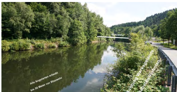
Los XI Staumwehr Buchenhofen

(Los X – XIII) Es besteht für die gesamte Strecke eine max. Entnahme von Salmoniden von 20 Stück pro Jahr!