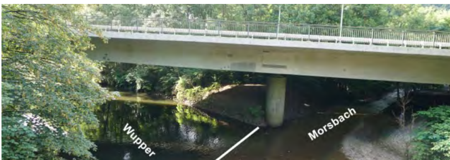
Los XIII Ende

Es besteht für die gesamte Strecke eine max. Entnahme von Salmoniden von 20 Stück pro Jahr!